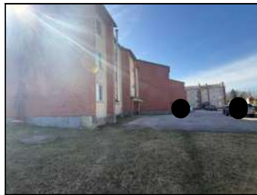
Skats uz daudzdzīvokļu dzīvojamās ēkas iekšpagalmu