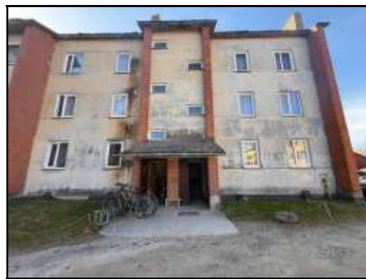
Skats uz kāpņutelpu