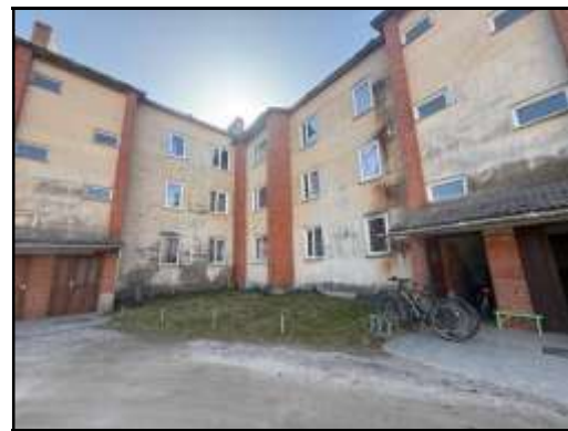
Skats uz daudzdzīvokļu dzīvojamās ēkas iekšpagalmu