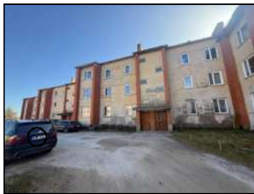
Skats uz daudzdzīvokļu dzīvojamās ēkas iekšpagalmu