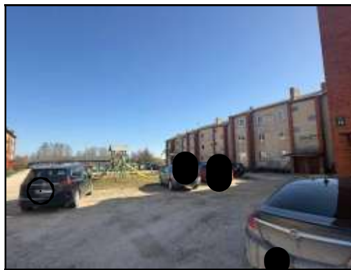
Skats uz daudzdzīvokļu dzīvojamās ēkas iekšpagalmu