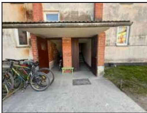
Skats uz kāpņutelpas ieejas durvīm